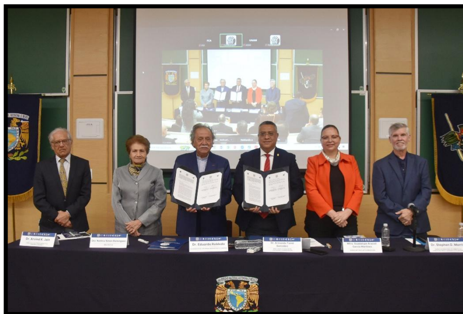
Firma de las bases de colaboración, momentos previos a la inauguración.

Al término de la cuarta mesa académica del Segundo Coloquio Internacional de Primavera 2026 del PUGOB, que se llevó a cabo en la Facultad, se firmaron las bases de colaboración que formalizan la creación del centro, con lo que se consolida la alianza entre ambas instancias universitarias después de tres años de trabajo.