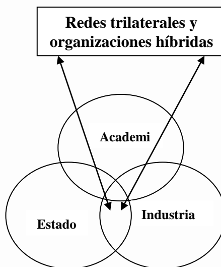
Figura 3. Modelo de triple hélice Relación universidad-gobierno-industria.

La figura 3, representa una clara integración entre los tres entes, donde los límites entre cada uno de ellos se desdibujan y donde cada esfera se encarga un poco de las actividades de los otros dos entes. Incluso se plantean organizaciones híbridas entre ellas que puedan contribuir al desarrollo regional