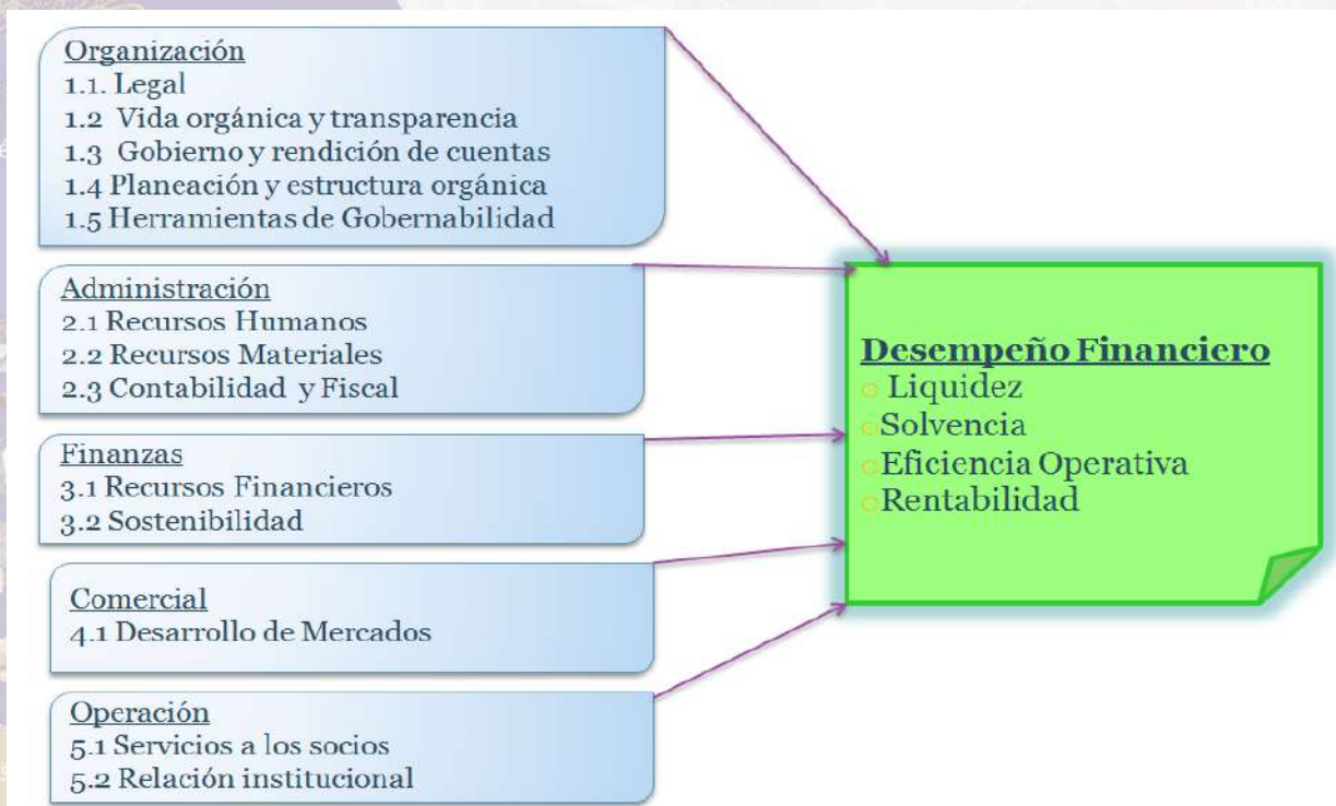
Figura 2 Operacionalización de Variables