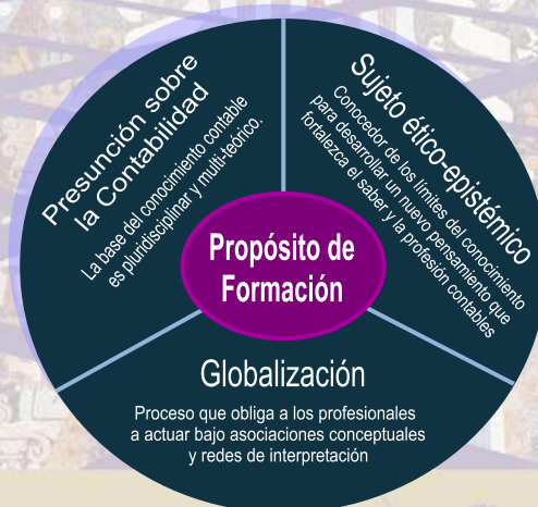
Gráfico 1. Propósito de Formación del Programa

La propuesta formativa pretende que los estudiantes y los profesores recreen lecturas del pasado, el presente y el futuro del saber contable, para así identificar las diferentes formas y contextos en los cuales los profesionales y los pensadores de la Contabilidad han producido y promovido el sentido del saber contable.